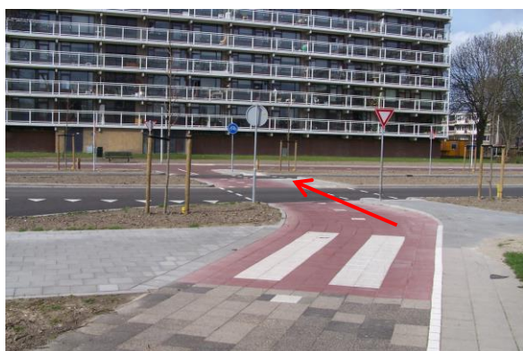
Steek rechtdoor de Winston Churchillaan over