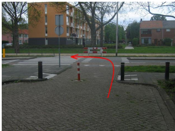
Steek aan het eind van de Geraniumstraat de Willemshoevelaan over en ga linksaf