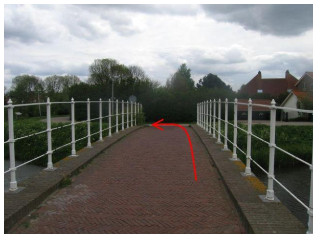
Ga na de brug linksaf de Breekade op fietspad