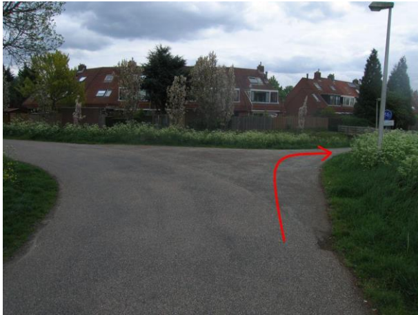
Houd rechts aan en vervolg je weg op de Vereijleweg