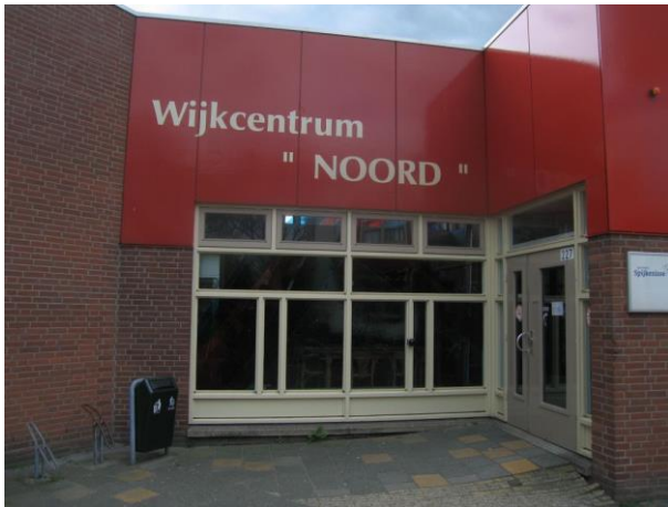
De route begint bij wijkcentrum "Noord" aan de Winston Churchillaan 27