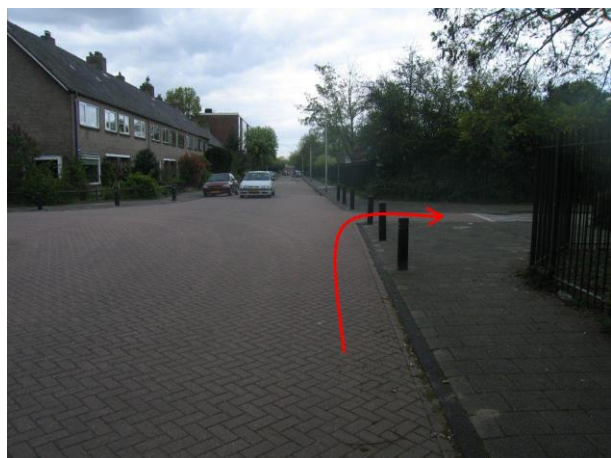
..de eerste weg rechts, de Geraniumstraat, in.