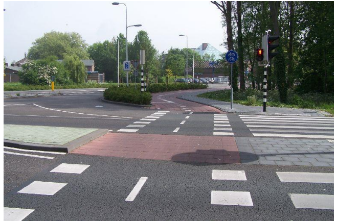
...en steek bij de verkeerslichten de Hekelingseweg over. Ga rechtdoor de Vredehofstraat in