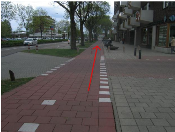
Blijf rechtdoor langs de Winston Churchillaan fietsen