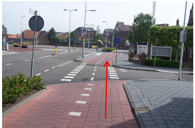
...tot aan de Eerste Heulbrugstraat