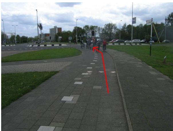
Steek bij de verkeerslichten de Groene Kruisweg over