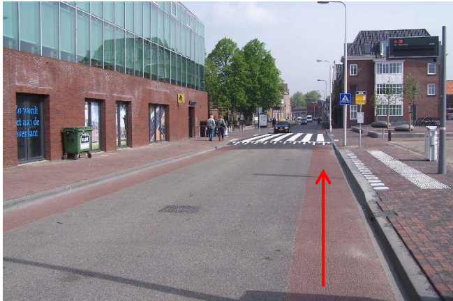
De Eerste Heulbrugstraat...