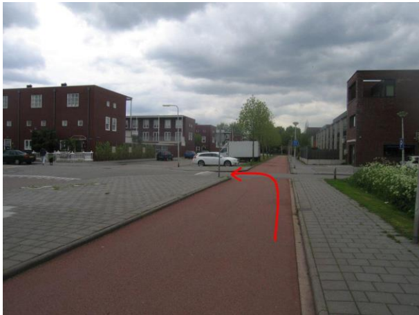
Ga linksaf, steek de Heijwegenlaan over en ga de Zinkseweg in