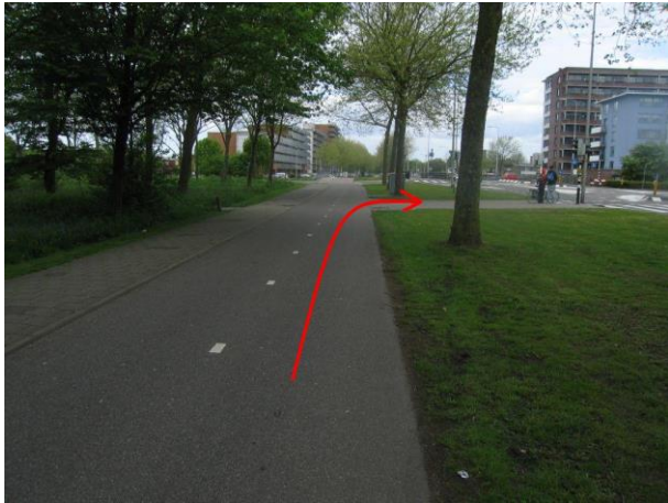
Ga bij de verkeerslichten rechtsaf...