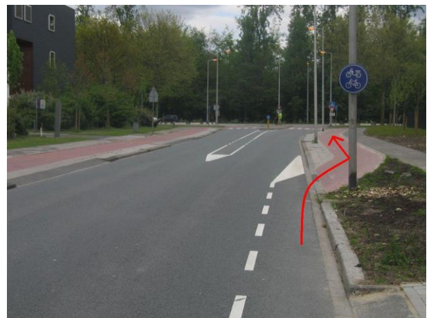
Ga voor het kruispunt het vrijliggende fietspad op