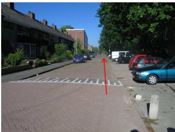
Ga in de Lisstraat...