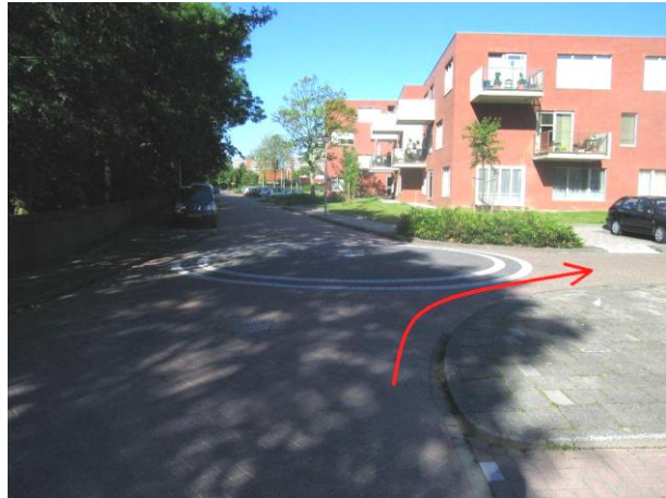
...de eerste straat rechtsaf....