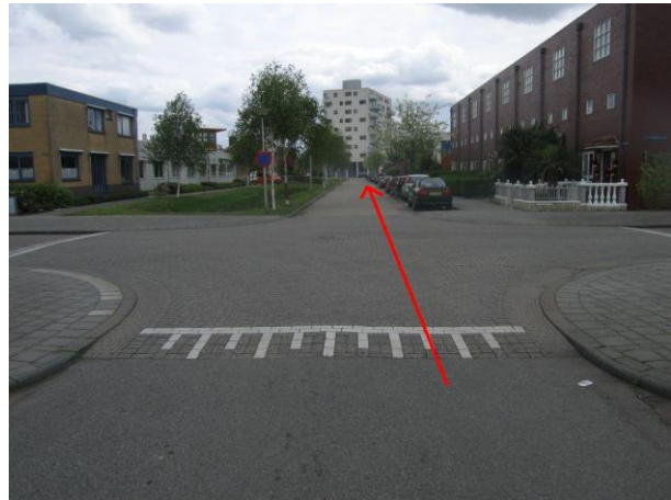
Fiets rechtdoor door de Zinkseweg