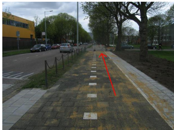
Fiets door de Willemshoevelaan.