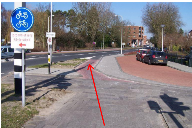
Fiets na het oversteken rechtdoor de Rozenlaan in