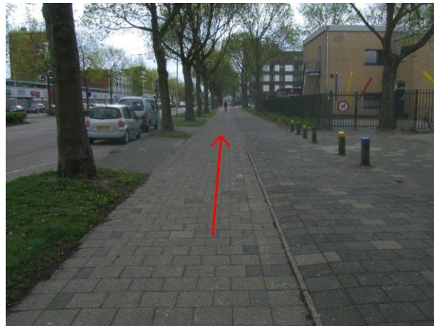
Fiets langs de Winston Churchillaan in de richting van de Groene Kruisweg