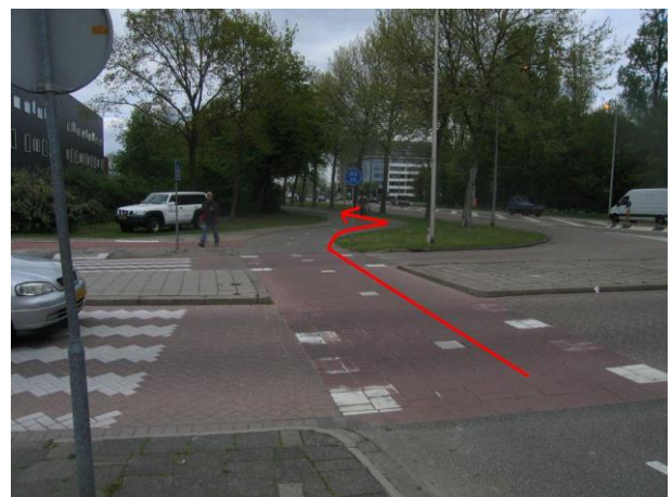
Fiets langs de Hekelingseweg