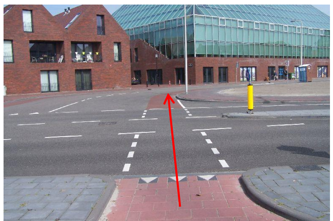
Volg de Eerste Heulbrugstraat in de richting van de Groene Kruisweg