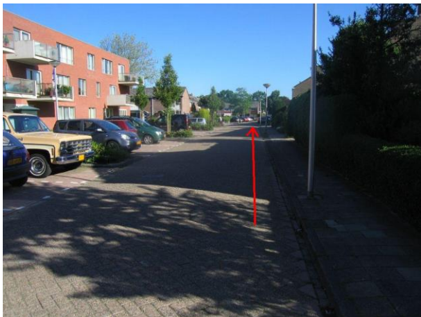
...de Madeliefstraat in.