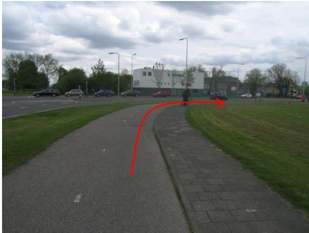
Volg het fietspad langs de Hekelingseweg