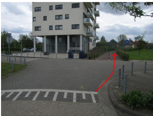
Steek de J. De Baanlaan over en ga rechtdoor het fietspad op