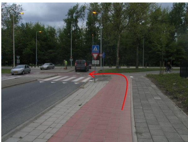
Ga voor de Hekelingseweg linksaf en steek de Hoeklaan over.