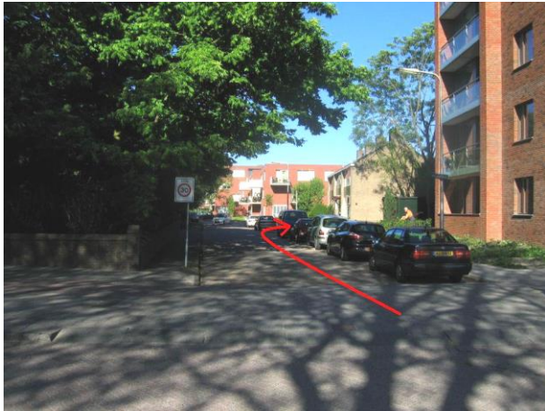
Ga in de Hoogwerfsingel ...