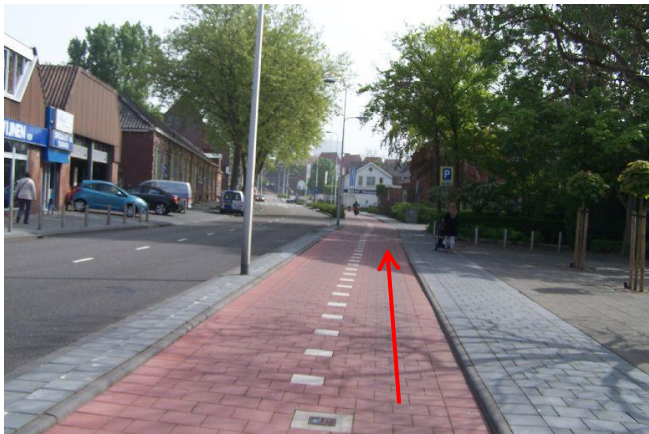
Fiets rechtdoor door de Vredehofstraat...