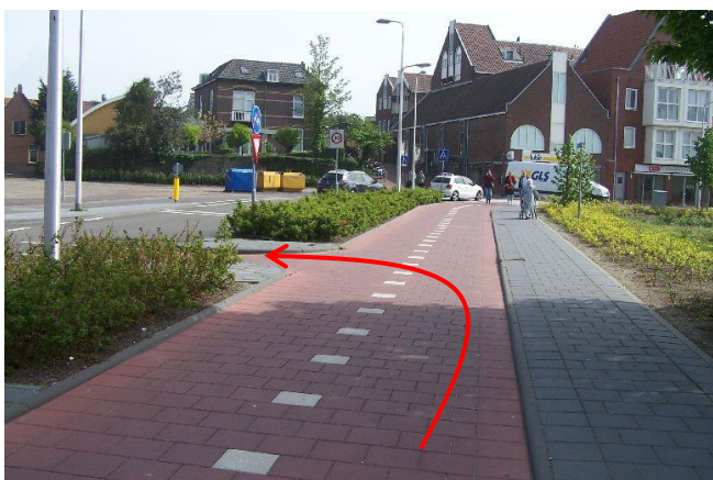
Ga bij de T-splitsing linksaf de Eerste Heulbrugstraat in.