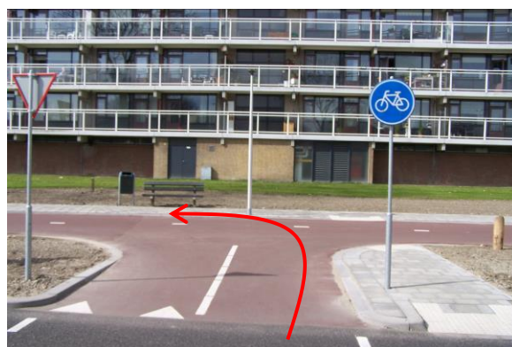
Ga na het oversteken linksaf en fiets terug naar het wijkcentrum