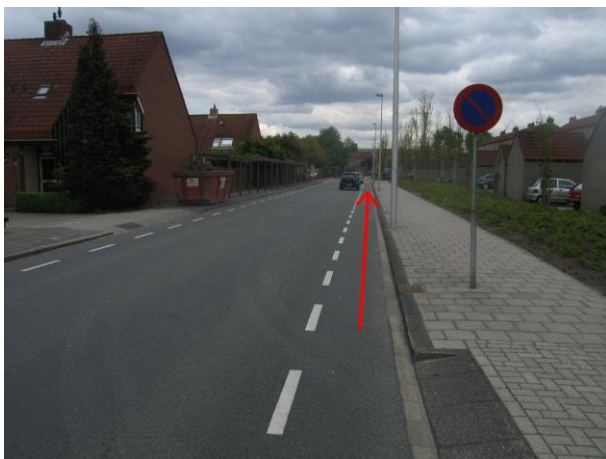
Volg de Hoeklaan tot het einde (de Hekelingseweg)