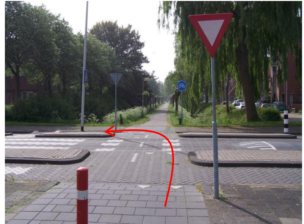
Ga linksaf de Hoeklaan op