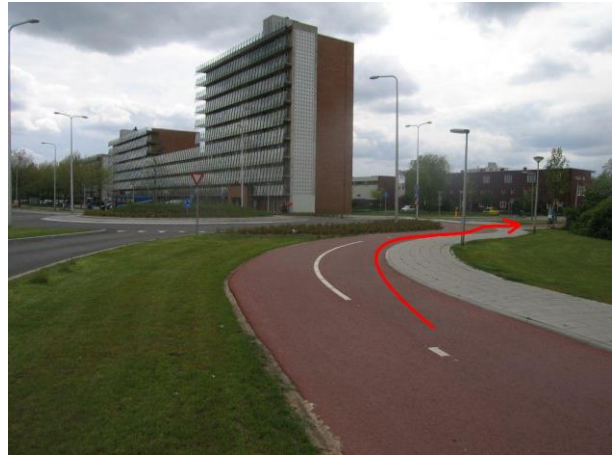
Ga bij de rotonde rechtsaf de Heijwegenlaan in (bij sporthal Den Oert)