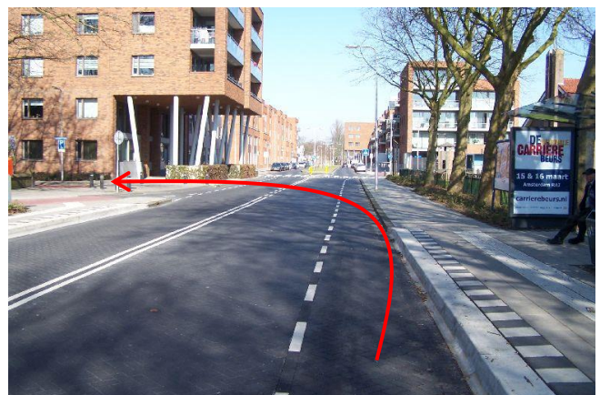
Ga de eerste straat linksaf de Hoogwerfsingel in