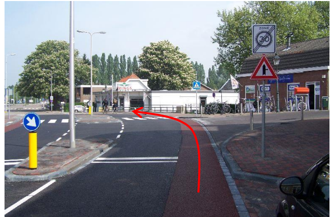
... de Eerste Heulbrugstraat...