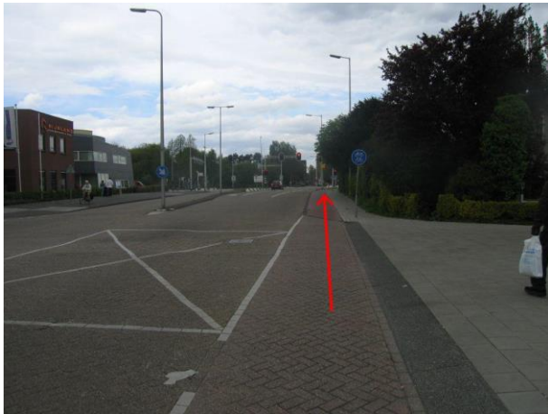
Ga het vrijliggende fietspad op