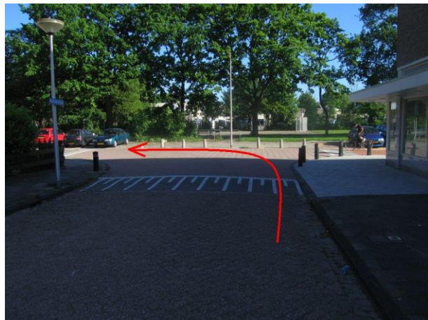
Ga aan het eind van de Madeliefstraat, bij de T-splitsing, linksaf de Lisstraat in