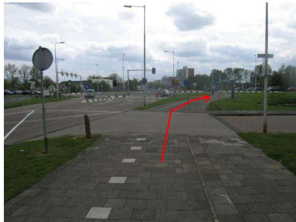
Fiets naar de verkeerslichten op het kruispunt Winston Churchillaan / Groene Kruisweg