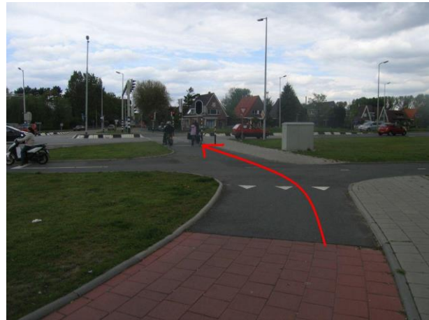
Steek bij de verkeerslichten de Groene Kruisweg over