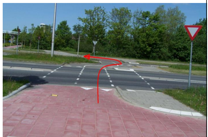
...en steek de Maaswijkweg dus over