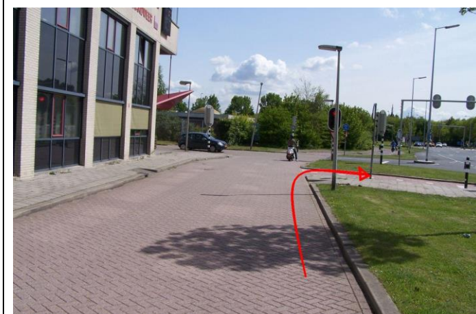
...en ga bij de verkeerslichten rechtsaf