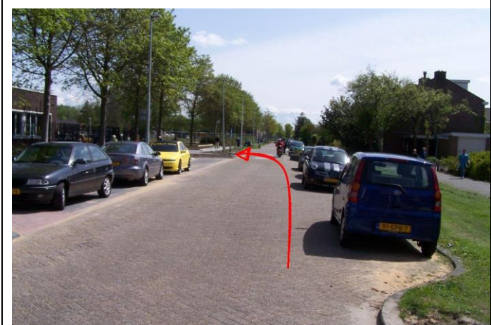
Fiets door de Beukenlaan weer terug naar het startpunt.