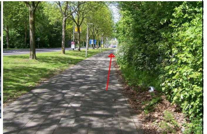
...tot aan het kruispunt met de Maaswijkweg