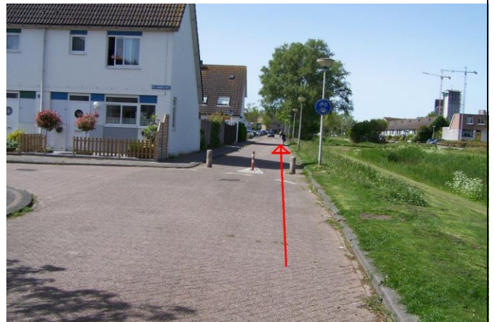
Fiets rechtdoor door de Missouristraat