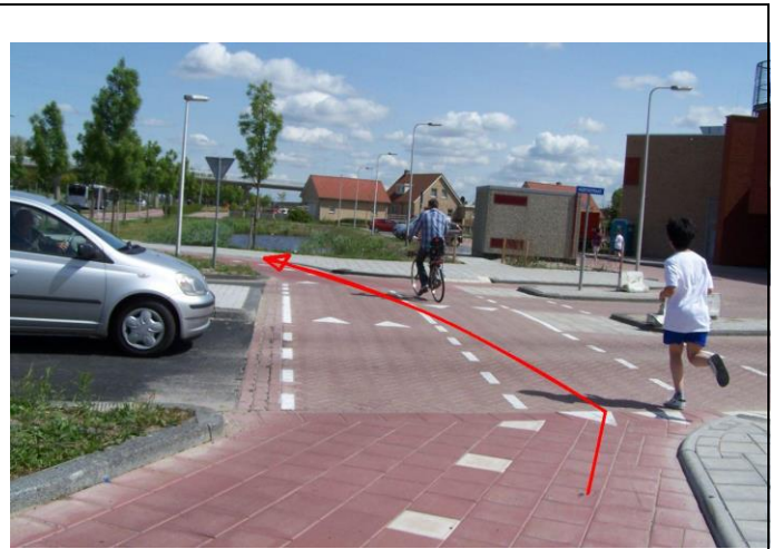
Neem de rotonde driekwart...