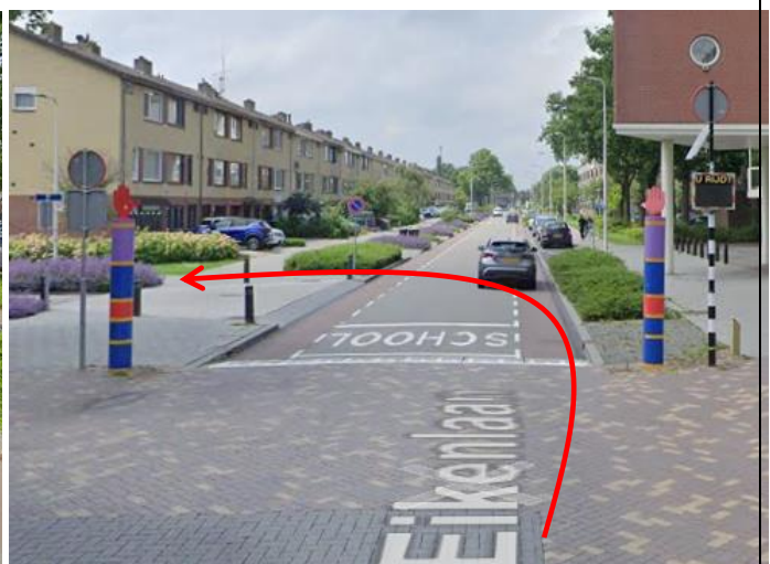
Ga na het wijkcentrum linksaf de Beukenlaan in