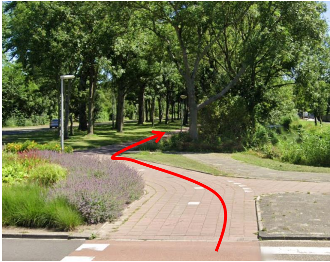
Ga rechtsaf en fiets langs de Heemraadlaan naar de Schenkelweg