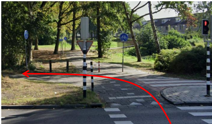
Fiets na het oversteken linksaf en fiets langs de Schenkelweg...