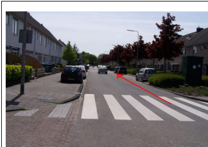
Fiets door de Rijnlaan...