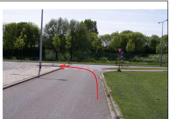
...en ga aan het eind van de Rijnlaan linksaf het fietspad langs de Schenkelweg op