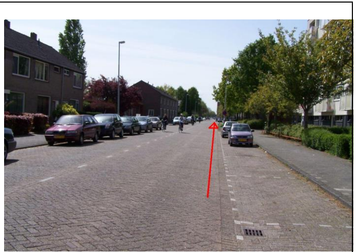
Blijft rechtdoor door de Eikenlaan fietsen..