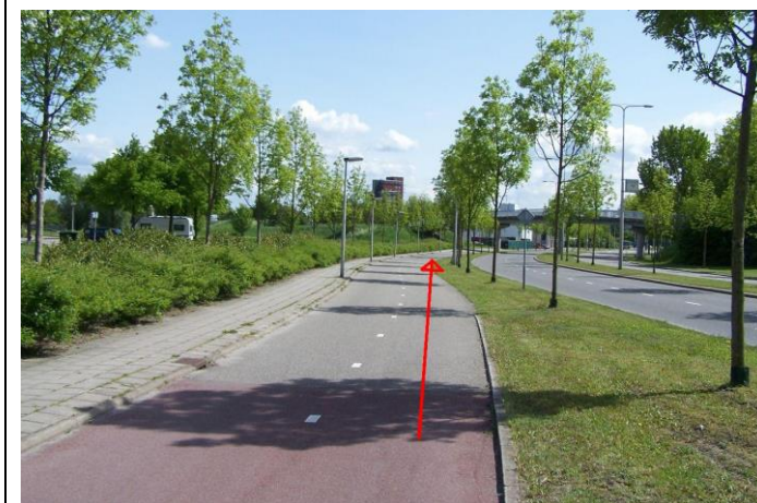
Fiets langs de Schenkelweg, onder de fietsbrug door, in de richting van de Brandweer