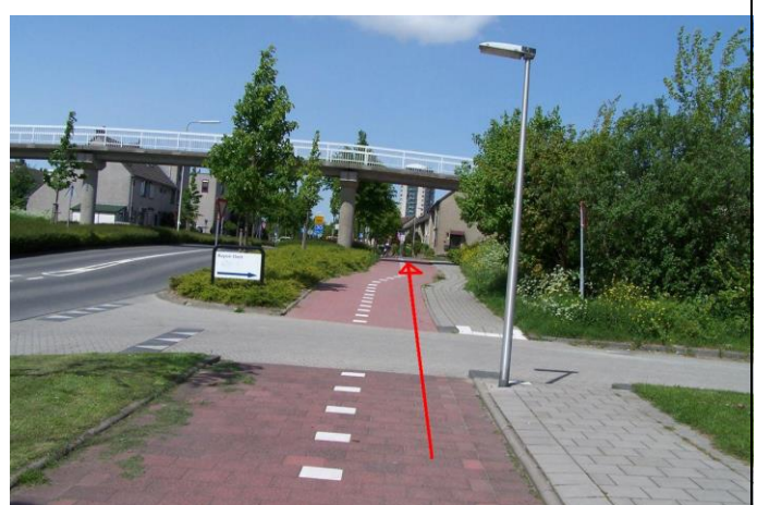
...de Rivierlaan in