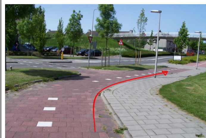
Ga dan rechtsaf...