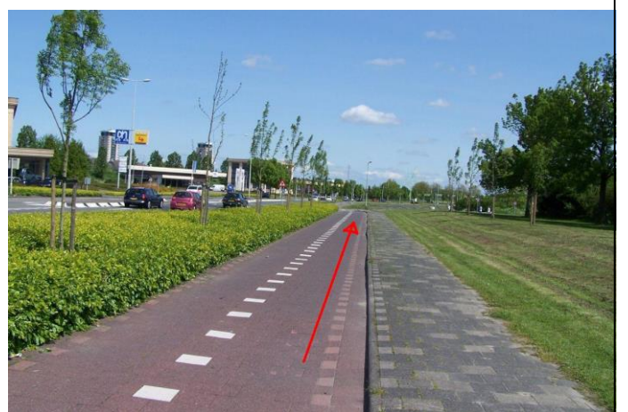
...en fiets langs de Maaswijkweg