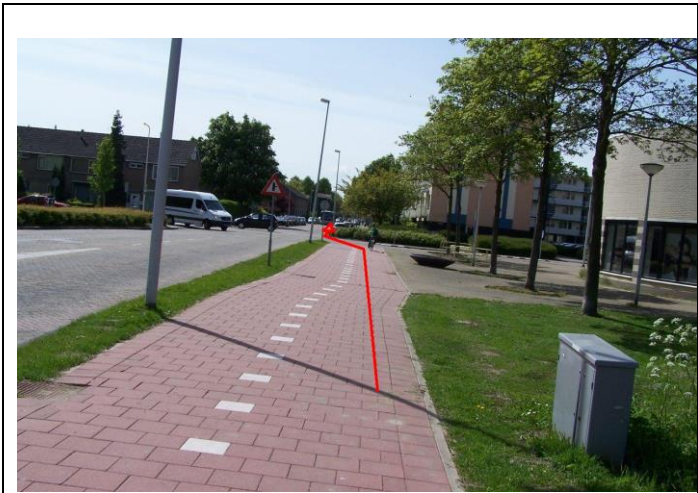
Ga rechtdoor de Eikenlaan in