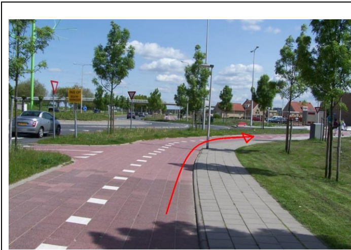
Fiets naar de rotonde Maaswijkweg / Rivierenlaan