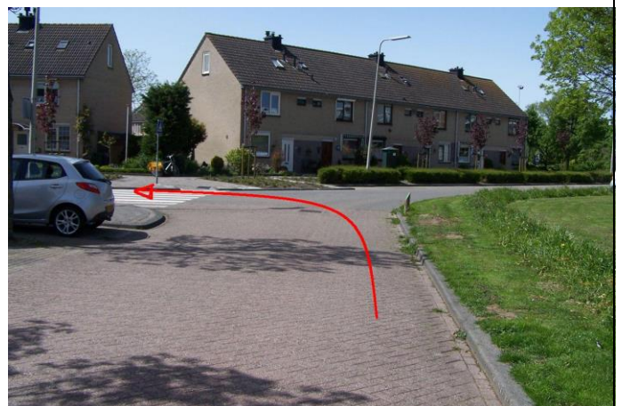
Ga linksaf de Rijnlaan in