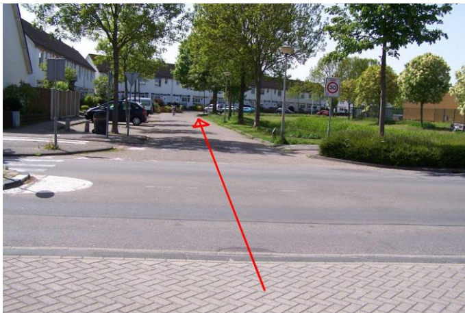
....en ga de Missouristraat in