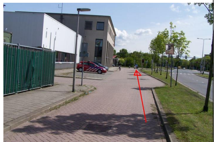
Fiets langs de Brandweer...