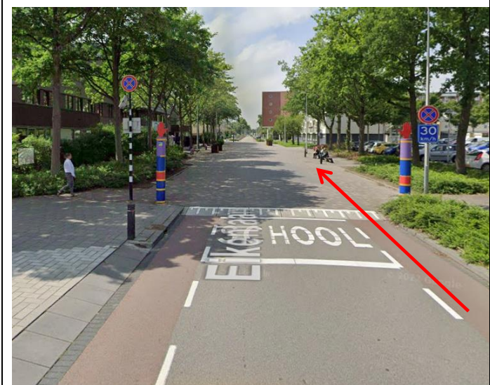
... tot voorbij het wijkcentrum