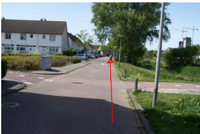
Tot de Y-splitsing met de Rijnlaan