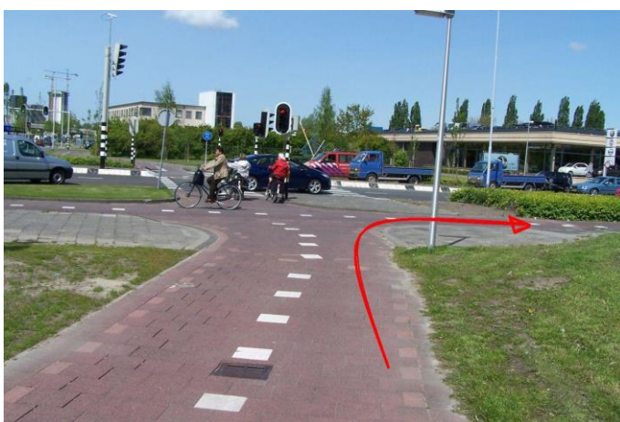
Ga voor het kruispunt rechtsaf...