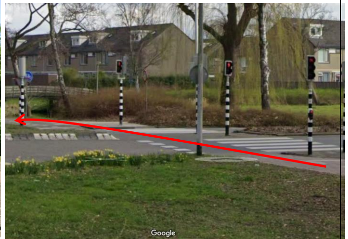
Steek bij de verkeerslichten de Schenkelweg over