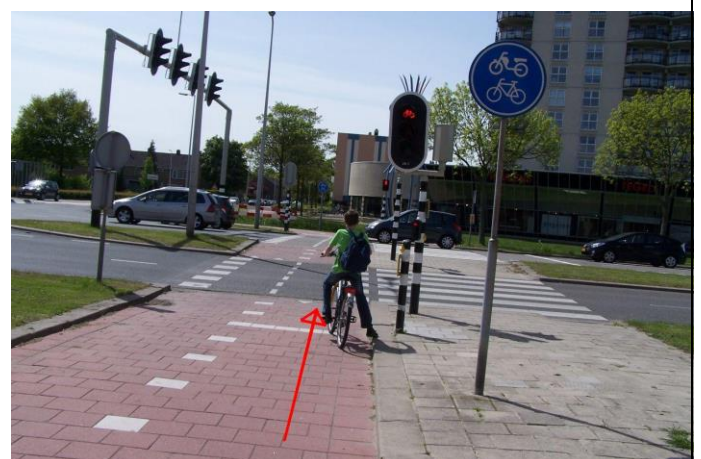
Steek bij de verkeerslichten de Schenkelweg over