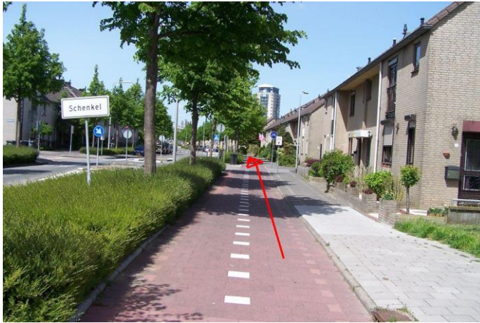
Blijf langs de Rivierlaan fietsen